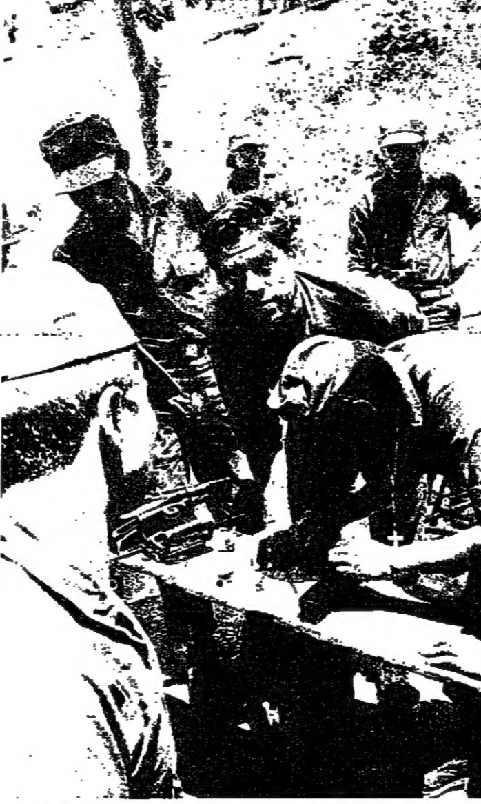
مروسة في تفكيك السلاح على ايدي فارين من القوى الثورية